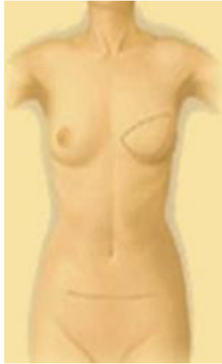
乳房重建術後外觀