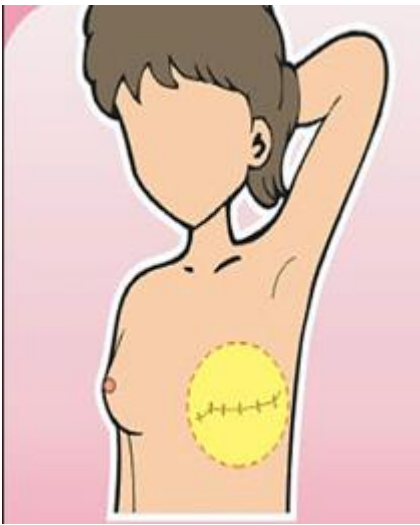
乳房全切除術後外觀